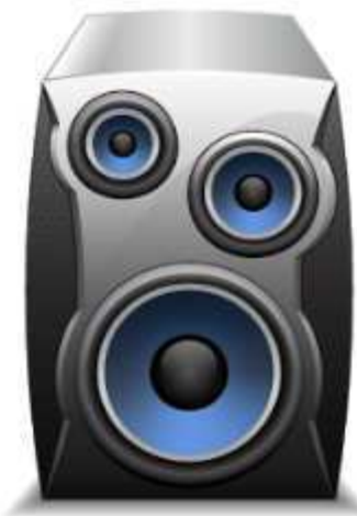
Générateur de fréquences